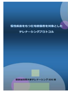
聖路加国際大学テレナーシングSIG編 慢性疾患をもつ在宅高齢者を対象としたテレナーシングプロトコル ＜参加者には当日差し上げます＞