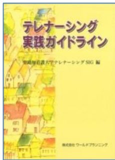
聖路加看護大学テレナーシングSIG編 テレナーシング実践ガイドライン (株)ワールドプランニング, 2013. (ISBN 978-4-86351-059-3) (定価2,000円+税)